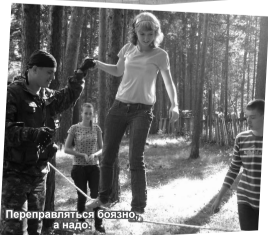
Переправляться боязно, а надо.