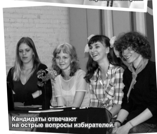
Кандидаты отвечают на острые вопросы избирателей.