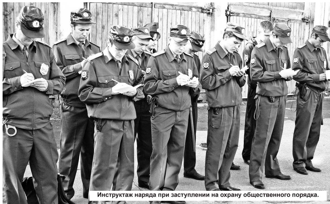
Инструктаж наряда при заступлении на охрану общественного порядка.

Наталья ФРОЛОВА.