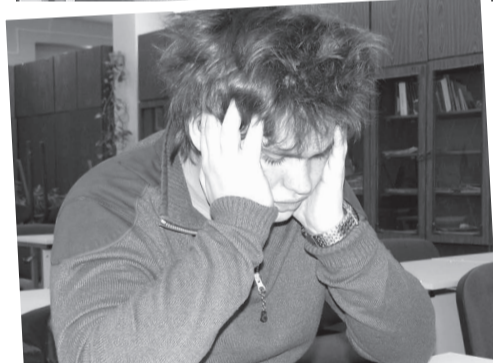
Виктор в муках творчества или, каких-то других муках...