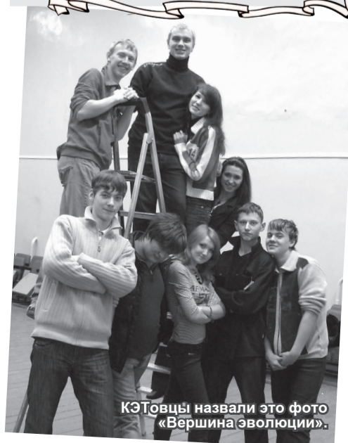
КЭТовцы назвали это фото «Вершина эволюции».