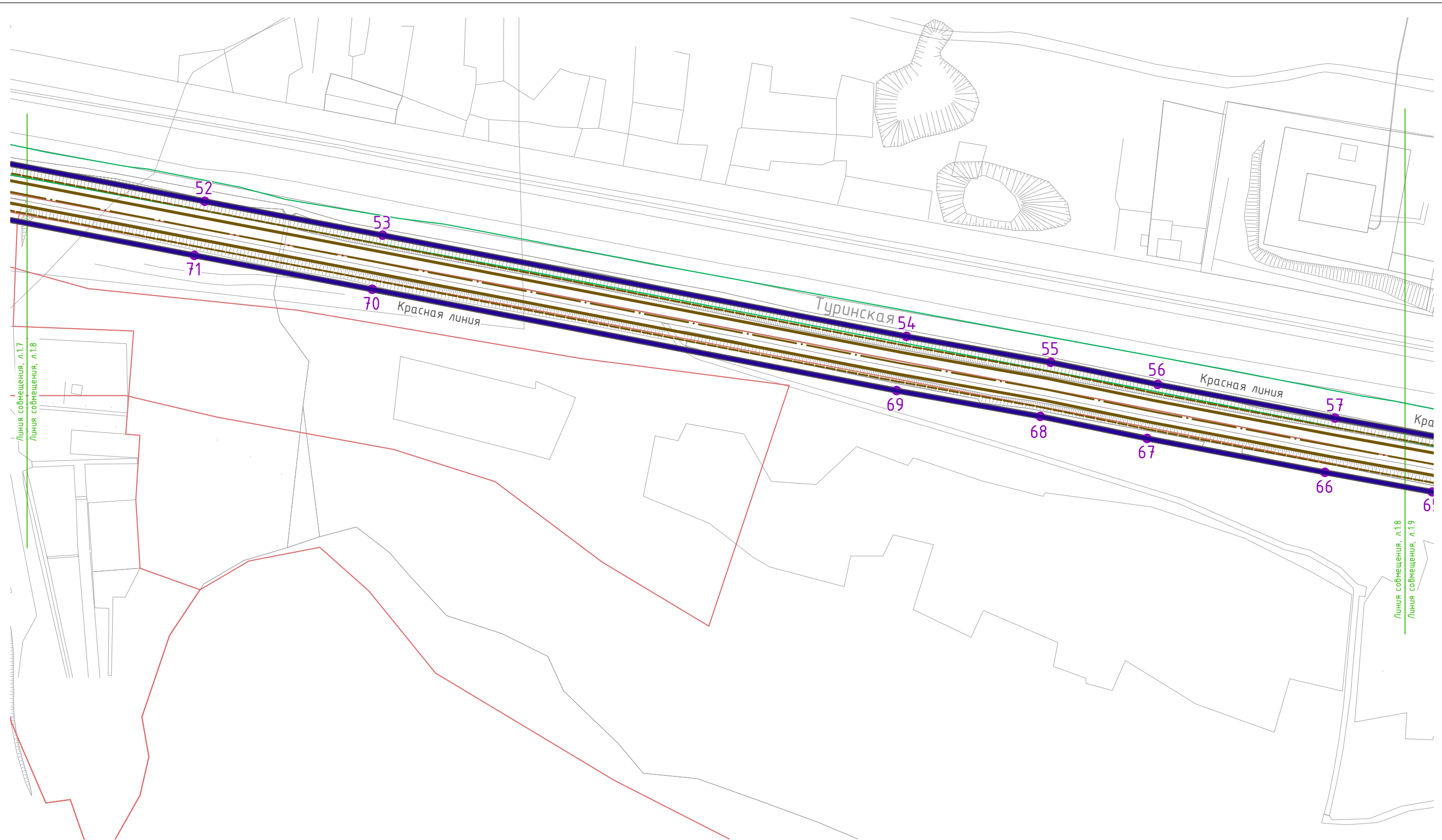
Схема совмещения листов