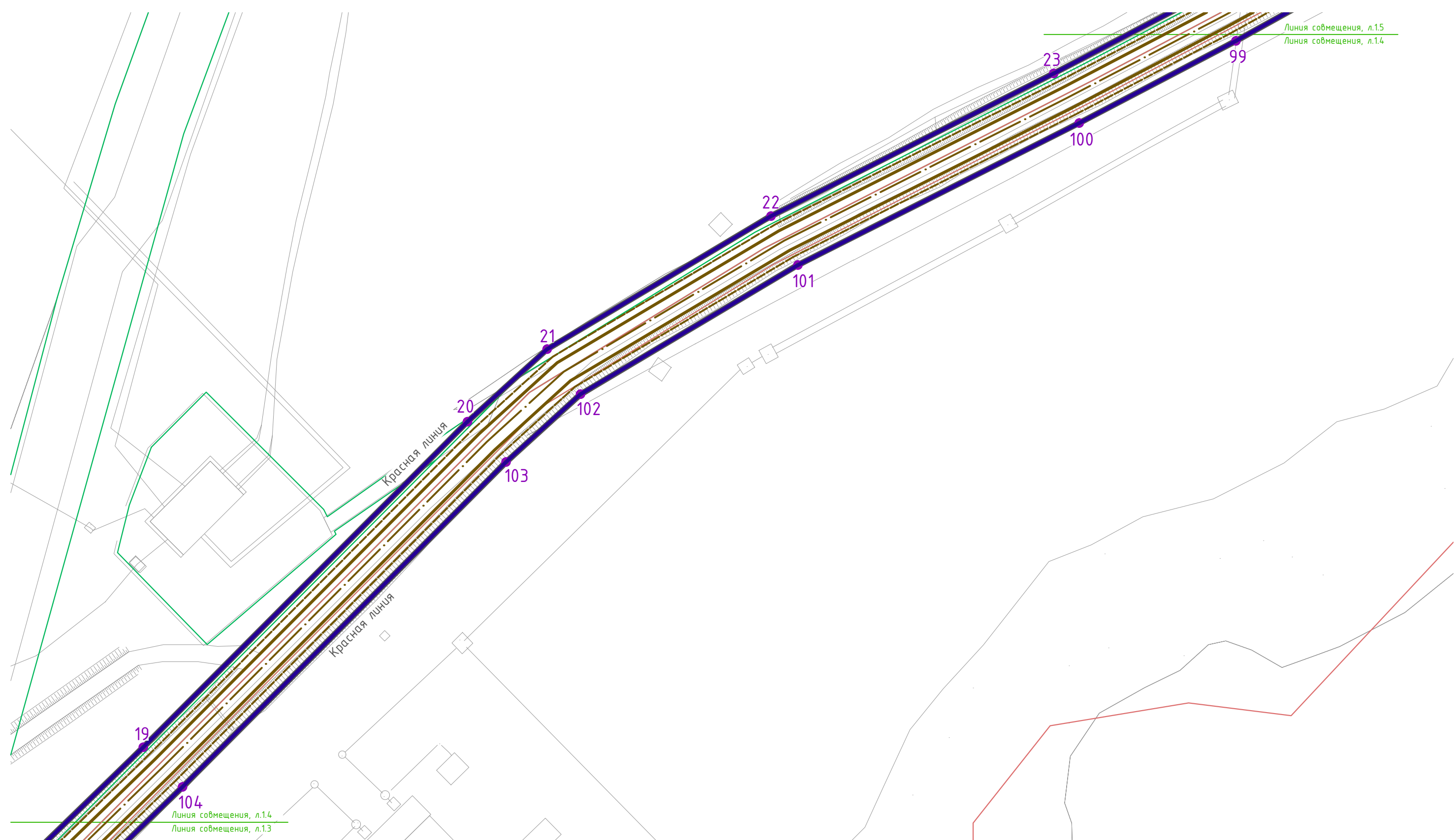
Схема совмещения листов