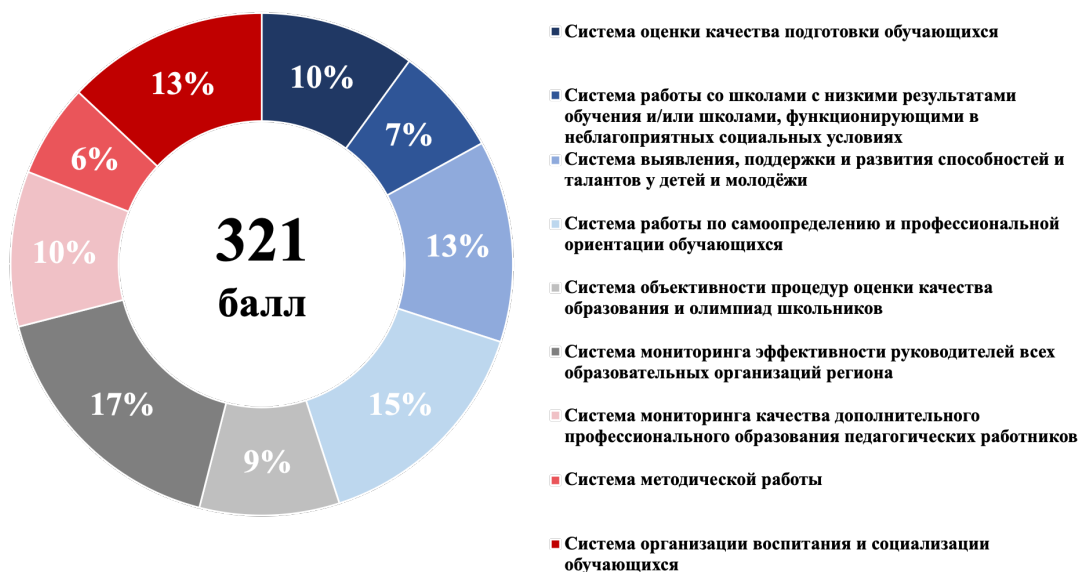
Рисунок 2 – Структура итогового балла

1.8. Максимальный итоговый балл по результатам проведения оценки составляет 321 балл. Структура итогового балла представлена на рисунке 2.