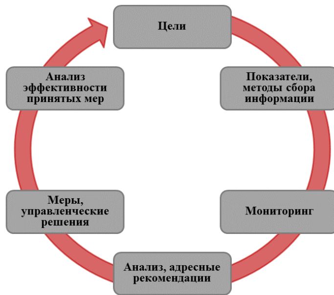
Рисунок 3 – Структура управленческого цикла

Реализация первых двух компонентов возможна через разработку регионами концептуальных документов (программ). Последующие четыре компонента реализуются через принятые регионами подходы (действия).